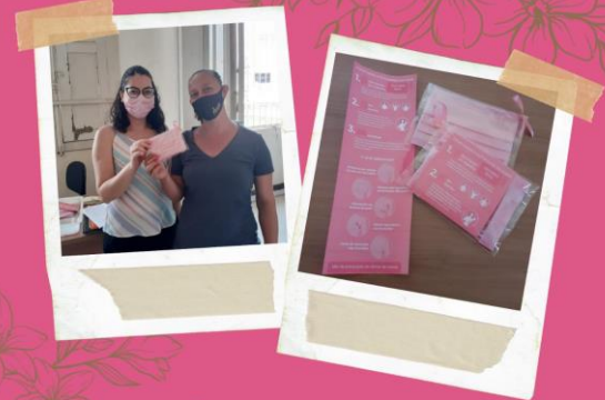
AÇÃO OUTUBRO ROSA Pastoral do Menor - FAC Jaú