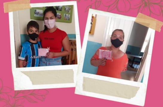
AÇÃO OUTUBRO ROSA Pastoral do Menor - FAC Jaú