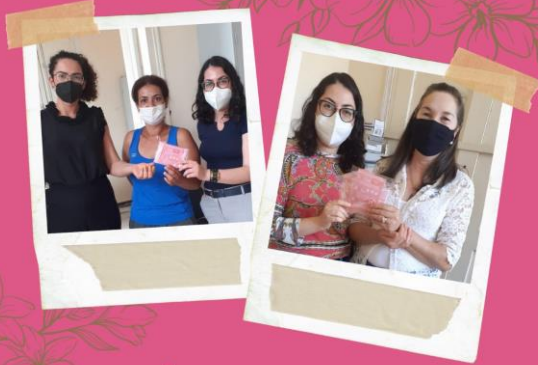
AÇÃO OUTUBRO ROSA Pastoral do Menor - FAC Jaú