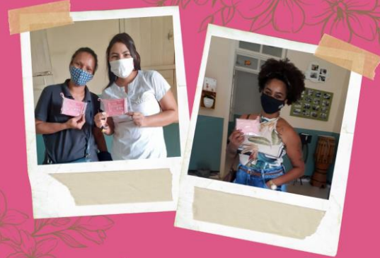
AÇÃO OUTUBRO ROSA Pastoral do Menor - FAC Jaú