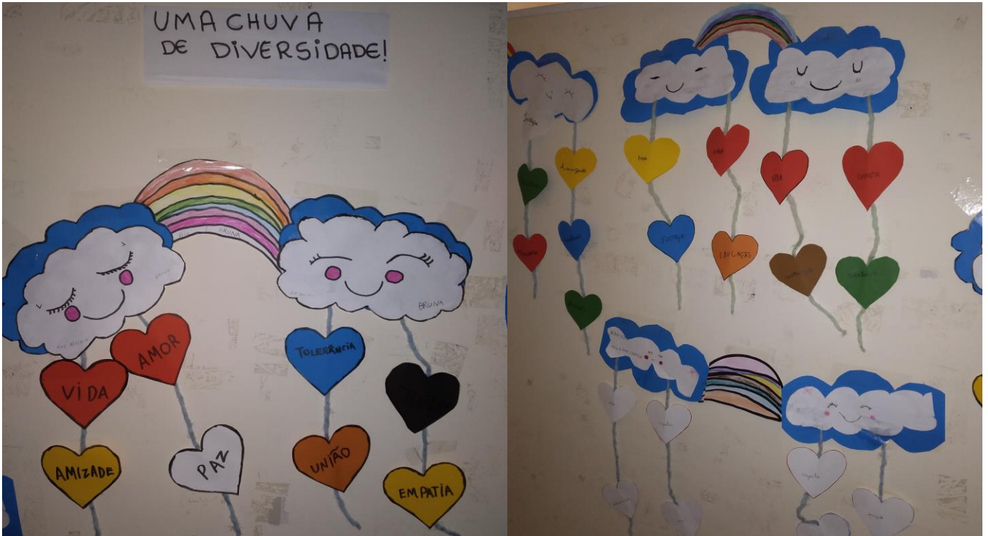
Mural feito com a atividade “Chuva de Diversidade”.

NÚCLEO PASTORAL DO MENOR: Rua Rangel Pestana, 340 - CEP 17201-490 - Jaú - SP - Fone: (14) 3624-5888