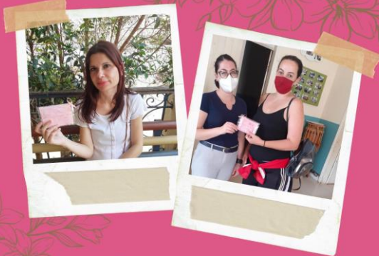
AÇÃO OUTUBRO ROSA Pastoral do Menor - FAC Jaú