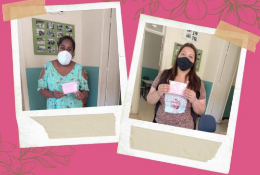
AÇÃO OUTUBRO ROSA Pastoral do Menor - FAC Jaú

NÚCLEO PASTORAL DO MENOR: Rua Rangel Pestana, 340 - CEP 17201-490 - Jaú - SP - Fone: (14) 3624-5888